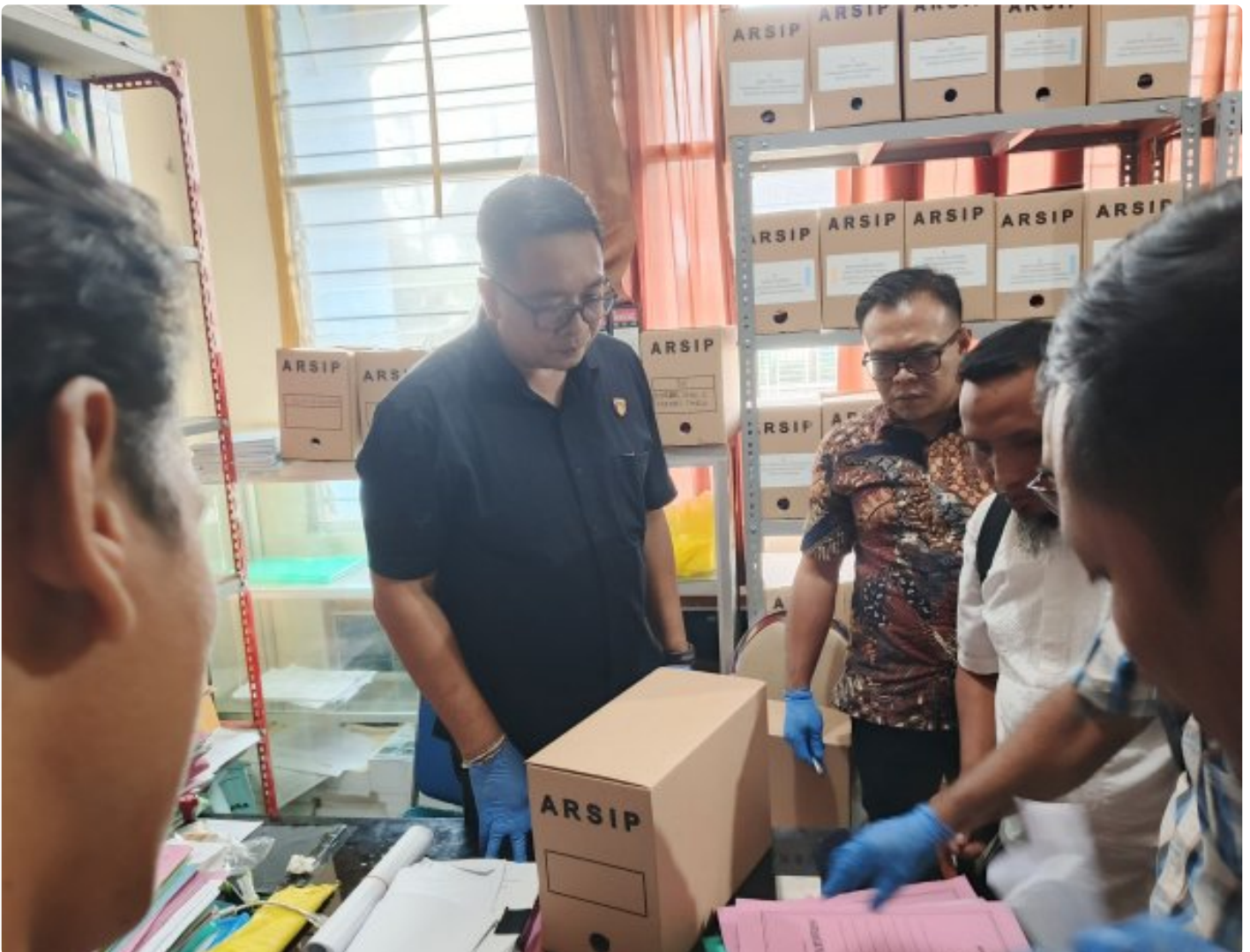
Saat Penggeledahan di Dikbud NTB, Jumat (13/12/2024)